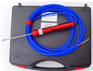
RHSP-06-C 6米定制吸枪, M5外螺纹