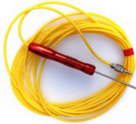
RHSP-05-2, 10米 对应SNC2E1T1