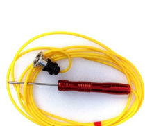
RHSP-05-1, 5米 对应SL2xx, SL3xx等