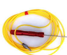
RHSP-05-2, 5米 对应SNC1E1T1