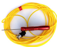
RHSP-10-1, 10米 对应SL2xx, SL3xx等